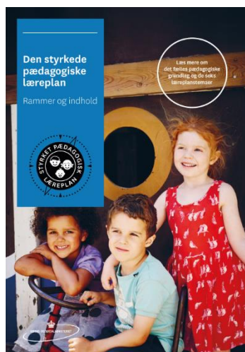
Den styrkede pædagogiske læreplan. Rammer og indhold

Personalet i Klynge B har to gange om året fælles personalemøder, hvor der arbejdes med at opbygge et fælles vidensgrundlag, samt at understøtte faglig sparring. Personalet har forskellige funktioner i de enkelte enheder i forhold til den faglige udvikling, og her arbejdes der også på tværs af Klyngen. Som eksempler kan nævnes: sprognævnet, Kbh. barn netværk, netværk mellem køkkenpersonalet og også de faglige fyrtårne.